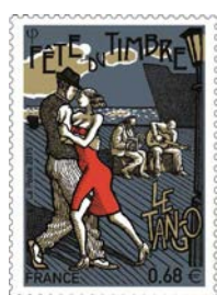
Timbres 2015 Le Tango et la Danse contemporaine