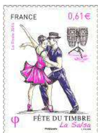
Timbres 2014 La Salsa et la Danse de rue

Pour voyager à travers les différentes expressions corporelles cette série a débuté avec la Salsa et la Danse de rue