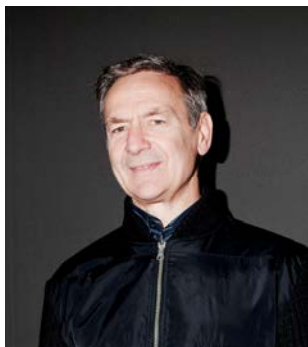
© FRED KIHN / Le Lombard 2017

Son échec provoque une crise sans précédent dans l'armée. La désillusion et la colère emportent les poilus. Il faut arrêter les frais et le 15 mai, le général Nivelle est remplacé par le maréchal Pétain.